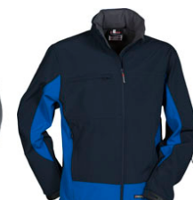
BLU NAVY/BLU ROYAL